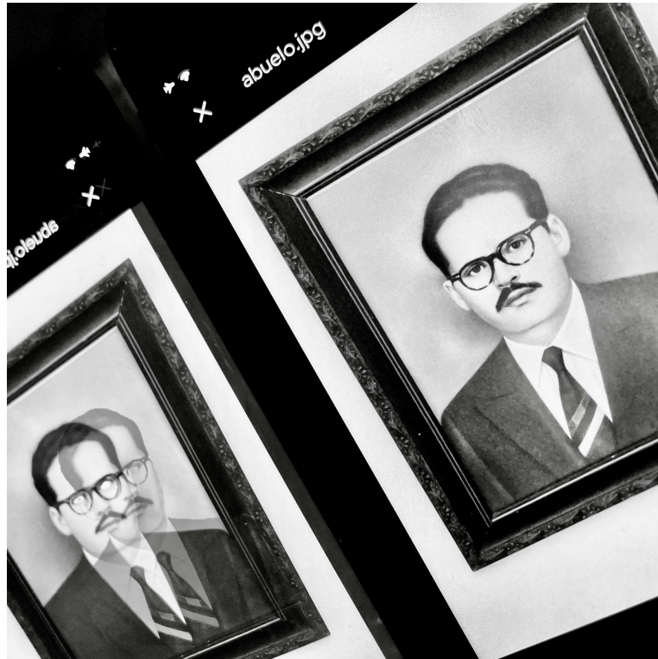
I. La Casa. FAMILIA