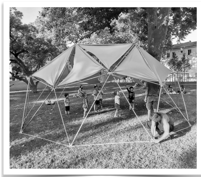
Dôme créer dans le cadre d'une transhumance artistique organisée par Animakt en 2021

La durée et le contenu précis de l'atelier restent à définir et à expérimenter.