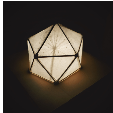
Maquette du dôme

A cour, un musicien suffisamment visible du public mais en retrait de la comédienne.